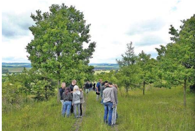
Auf Entdeckungstour auf dem ehemaligen Todesstreifen: Eichsfelder Schüler kartieren an der Roten Warte das Grüne Band.

Mit dem Beginn des Mauerbaus am 13. August 1961 in Berlin gab die DDR-Regierung gleichzeitig das Zeichen für eine massive Verstärkung der innerdeutschen Grenze auf ihrer Gesamtlänge von 1400 Kilometern – und somit auch im danach geteilten Eichsfeld.