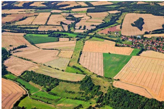
Umstrittenes Projekt: Landwirte fürchten um ihre Flächen.

Der Ortsrat von Etzenborn lehnt das sogenannte Naturschutzgroßprojekt „Grünes Band Eichsfeld-Werratal“ an der ehemaligen deutsch-deutschen Grenze vorerst ab. Die anderen betroffenen Dörfer in der Gemeinde Gleichen haben keine Einwände. Umstritten ist das Projekt vor allem bei Landwirten.